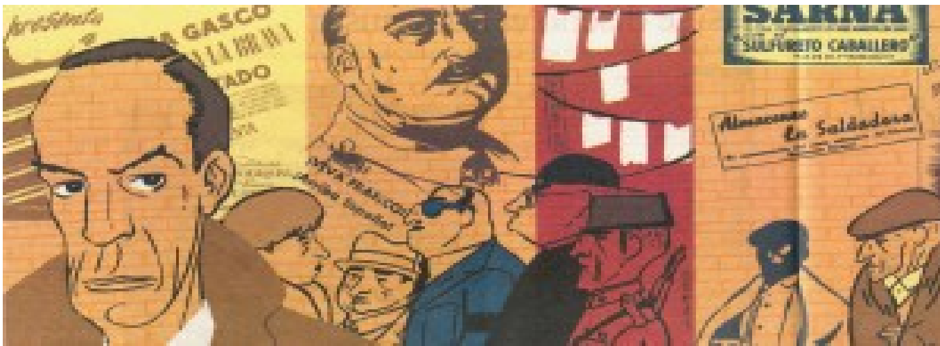
Camilo José Cela, La Colmena

“.....Doña Rosa no era, ciertamente lo que se suele decir una sensitiva.